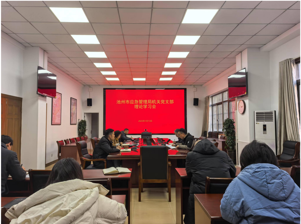
1月13日，市应急局机关党支部开展理论学习。