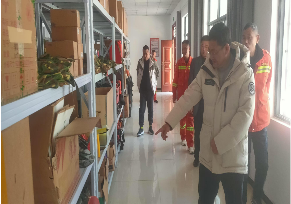
1月30日，党委书记、局长斯文暗访督查东至县烟花爆竹批发企业安全生产和春节值班值守情况，督查东至县森林防火专业队森林防火备勤和春节值班值守情况。