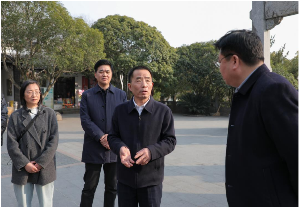
1月22日，市委副书记、市长贺东实地督导检查春节安全生产、市场保供和春运保障等工作。