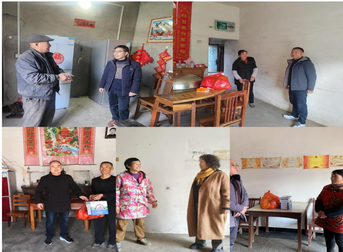
1月13日，班子成员赴帮扶社区永兴社区开展帮扶慰问工作。