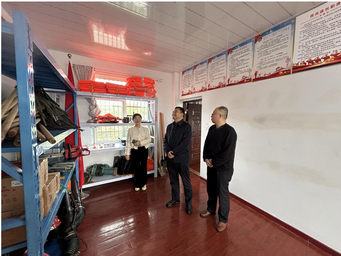
11月15日，党委书记、局长斯文赴贵池区调研森林防灭火工作。