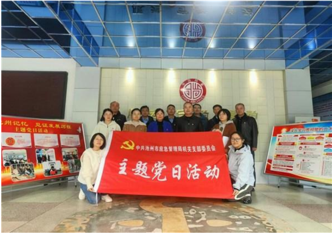
11月19日，市应急管理局机关党支部组织党员干部赴市档案馆开展主题党日活动。