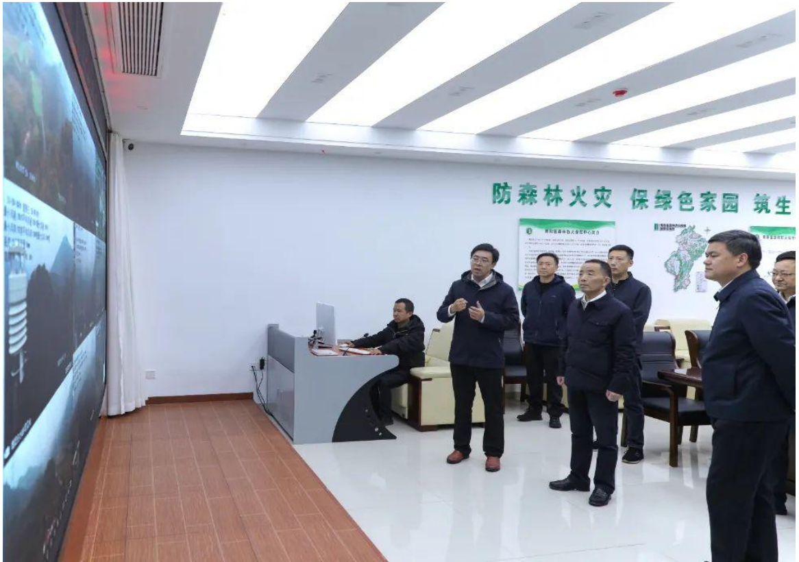
11月20日，市长贺东赴青阳县调研督导林长制及森林防灭火工作。